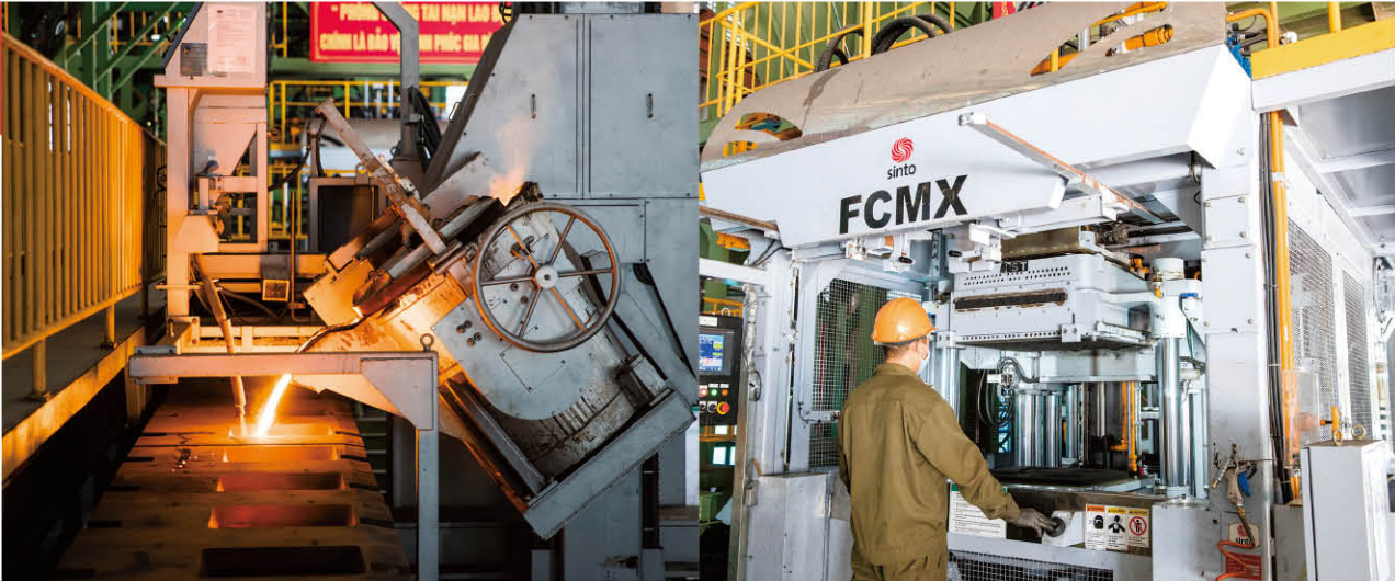
DISOCOの「自動生砂铸造ライン」は年産1万トン。現時点でベトナム最大かつ最先端の生産ラインである

納期」の3つのファクターに加え、顧客満足度の高さにも定評がある。同社は顧客のニーズや現状を把握し、最適な提案をコンサルティングする。これはWin・Winの関係性の元、顧客の持続可能な発展を願望する姿勢の表れである。